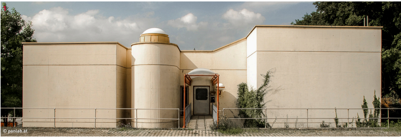
ORF-Expositur 1 FÜHRUNG 12:00 Gustav Peichl, 1968-70 Feiersteigweg 1, 7000 Eisenstadt

Ursprünglich in Wien beheimatet, erhielt das ORF Landesstudio Burgenland im Oktober 1970 eine Expositur in Eisenstadt. Der Neubau wurde „zum sichtbaren Ausdruck der im neuen Rundfunkgesetz festgeschriebenen föderalistischen Struktur des ORF“. Auch wenn die räumliche Organisation der Expositur sich von den späteren Studiobauten noch unterscheidet, besitzt der Bau, wie Friedrich Achleitner 1983 feststellte, bereits alle technischen und architektonischen Elemente – Stichwort Silberfarbe, technoide Wirkung etc. – des späteren Studiotypus. Ein einzigartiges Pilotprojekt für die revolutionären Neubauten der ORF-Landesstudios, dessen erstes 1972 in Salzburg eröffnet wird.