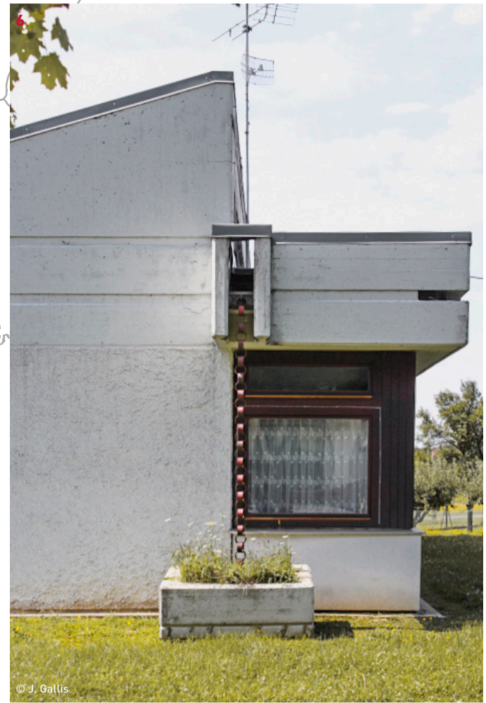
Volksschule Strem 6 Führung 16:00 Herwig Udo Graf, 1968-73 Hauptstraße 1, 7522 Strem

Der ebenerdige Schulbau mit innenliegendem, kleinem Atrium und typischer, plastischer Ausbildung des Baukörpers ist die letzte erhaltene Schule aus dem bemerkenswerten Frühwerk des Architekten Herwig Udo Graf (1940-2023), der neben Matthias Szauer als Hauptvertreter des burgenländischen Brutalismus bezeichnet werden kann. Das durch strenge Symmetriebildungen geprägte Objekt, dem 1968 ein Architektenwettbewerb vorangegangen ist, zeigt auf eindruckliche Weise den hohen baukulturellen Qualitätsanspruch der an öffentliche Bauten im Burgenland einst gestellt wurde. Nicht zuletzt besitzt das Stremer Kleinod einen einzigartigen Symbolwert innerhalb der historischen Aufbruchsstimmung der brutalistischen Schul- und Kulturbauten des Burgenlands der 1960er und 1970er Jahre.