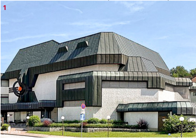
Kulturzentrum Oberschützen 1 Führung 10:00 Herwig Udo Graf, 1977-82 Hauptplatz 8, 7432 Oberschützen

Das Kultur- und Hochschulzentrum Oberschützen ist das letzte von insgesamt fünf derartigen, im Burgenland errichteten Einrichtungen, die der Bevölkerung dieselben bildungspolitischen und kulturellen Möglichkeiten bieten sollten, wie sie bisher nur in Großstädten zur Verfügung standen. Architekt Herwig Udo Graf wurde hier, aufgrund eines vorangegangenen Architekturwettbewerbes, zum zweiten Mal mit der Bauaufgabe „Kulturzentrum“ betraut, ging vom burgenländischen Brutalismus, der die Kulturzentren der ersten Generation – Mattersburg und Güssing – angehören in eine neue Formensprache über und interpretierte hierfür Gestaltungselemente um: aus der plastischen wie massiven Betonattika des Kulturzentrums Mattersburg wird eine eindrucksvolle Kupferblechlandschaft, aus béton brut werden grob verputzte Wandflächen etc. Mit der Eröffnung des Kulturzentrums Oberschützen am 25. Juni 1982 wird eine einzigartige kulturpolitische Offensive des Landes Burgenland, die in ihrem Anspruch und der baulichen Realisierung bis heute ihresgleichen sucht, vollendet.