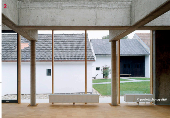
Forum Limbach 4 Looping Architecture, 2010 Am Wiesengrund 18, 7543 Limbach