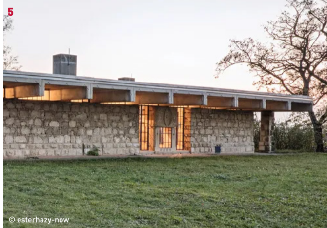
Bildhauerhaus St. Margarethen 5 Führung 15:00* / 16:00** Johann Georg Gsteu, 1962-67 Am Alten Bahnhof 3, 7062 St. Margarethen

Die Baulichkeiten des Burgenländischen Landesmuseums - das nach 1945 restituierte und 1958 vom Land Burgenland angekaufte Häuserensemble des vertriebenen jüdischen Weinhändlers, Sammlers und Kunstmäzens Sándor Wolf - befanden sich in der Nachkriegszeit in einem sanierungsbedürftigen Zustand. Die Grundidee des Mitte der 1960er Jahre vorgelegten Entwurfs der Wiener Architekten Hans Puchhammer und Gunther Wawrik bestand darin, drei der insgesamt fünf Häuser denkmalgerecht zu revitalisieren und zu adaptieren, die zwei weniger brauchbaren Objekte abzubauen, durch einen zweigeschossigen Ausstellungsraum sowie um ein insgesamt viergeschossiges Verwaltungsgebäude zu ergänzen. Der Architekturhistoriker Otto Kapfinger bringt die Qualitäten dieses, auch international vielbeachteten Museumsbaues und herausragenden Beispiel für das Weiterbauen in historischen Strukturen auf den Punkt: „Die Neubauten antworten in einer gelassenen Modernität auf die Rhythmen, Proportionen und Raumsequenzen des Bestandes. Aus dem Dialog der morphologisch-technischen Differenzen und der strukturellen Verwandtschaften resultierte eine neue Ganzheit.“