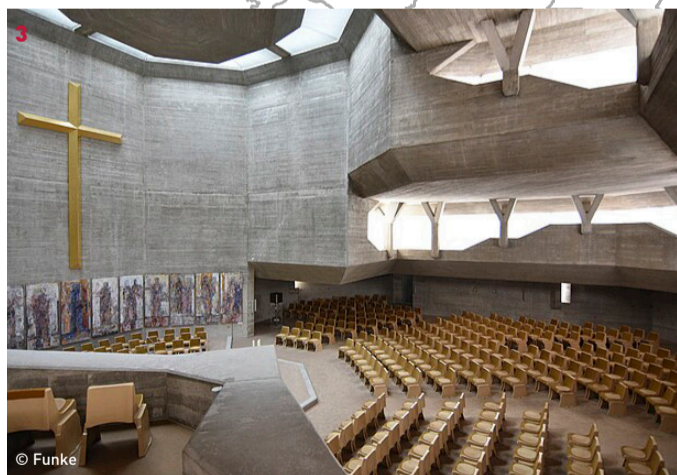
Osterkirche 3 Führung 14:00 Günther Domenig, Eilfried Huth, 1966-69 Steinamanger Straße 13, 7400 Oberwart von 10:00- 11:00 keine Besichtigung, da Gottesdienst

Als „Donnerschlag von Oberwart“ bezeichnete Friedrich Achleitner das zwischen 1966 und 1969 errichtete Seelsorgezentrum Oberwart und hat mit dieser Feststellung bereits 1983 – in seinem zweiten Band seines „Österreichischen Architekturführers“ – nicht übertrieben. Die Grazer Architekten Günther Domenig und Eilfried Huth realisierten, orientiert an Schweizer Vorbildern, eine einzigartige Anlage, die heute zu den Ikonen des Brutalismus in Österreich zählt und für das junge Architektenduo den Durchbruch bedeutete. Die skulpturale, kraftvolle wie kompromisslose Sichtbetonarchitektur gruppiert sich rund um einen zentralen, durch eine differenzierte Stiegenanlage erschlossenen Platz, an dem auch die alte Kirche liegt. Das Seelsorgezentrum zählt zu den bedeutendsten Bauten nach 1945 in Österreich und ist darüber hinaus ein vielbeachtetes Beispiel für den gelungenen Dialog zwischen Alt und Neu.