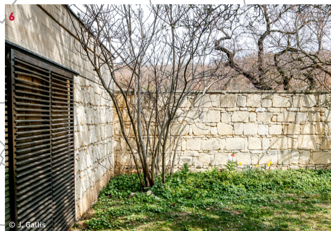
Haus Gruber 6 Roland Rainer, 1965 Am Alten Bahnhof 1, 7062 St. Margarethen

*mit Albert Kirchengast **Führung 16:00 Skulpturenensemble am Kogelberg Verein Akademie an der Grenze / Vitus Weh