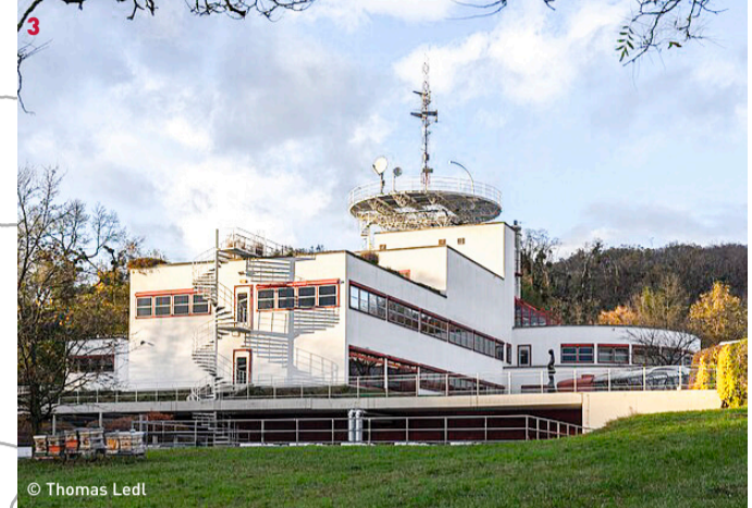
ORF Landesstudio Burgenland - Funkhaus Eisenstadt 3 Gustav Peichl, 1979-82 Buchgraben 51, 7000 Eisenstadt

Im Jahr 1959 wurde das erste, maßgeblich vom Bildhauer Karl Prantl initiierte, Bildhauer-Symposium im Steinbruch St. Margarethen abgehalten, das sich über die Jahre zu einem Fixpunkt im österreichischen Kulturgeschehen – für die Künstler aus dem ehemaligen Ostblock zum einem Symbol für künstlerische Freiheit über System und Ländergrenzen entwickelte. 1965-67 wurde nach den Plänen von Architekt Johann Georg Gsteu in der archaischen Landschaft für die Teilnehmer eine adäquate Unterkunft, das Bildhauerhaus, geschaffen. Dabei wurde eine ehemalige Kantine der Steinbruch-Arbeiter grundlegend umgebaut: mächtige Betonrippen ruhen heute als Dachkonstruktion auf den großteils erhaltenen Natursteinmauern, eine beinahe schon klösterliche Atmosphäre durchzieht das mit 1967 mit dem Bauherrenpreis ausgezeichnete Bildhauerhaus. Es gilt heute als Ikone der österreichischen Architektur nach 1945 und bildet gemeinsam mit den in der Umgebung liegenden Betriebsgebäude der Firma Hummel von Karl Schwanzler und den beiden Häusern von Roland Rainer – sein eigenes Sommerhaus sowie das Haus Gruber – ein einzigartiges Ensemble der österreichischer Nachkriegsmoderne, der differenzierten Auseinandersetzung mit dem Bauen in der freien Landschaft.